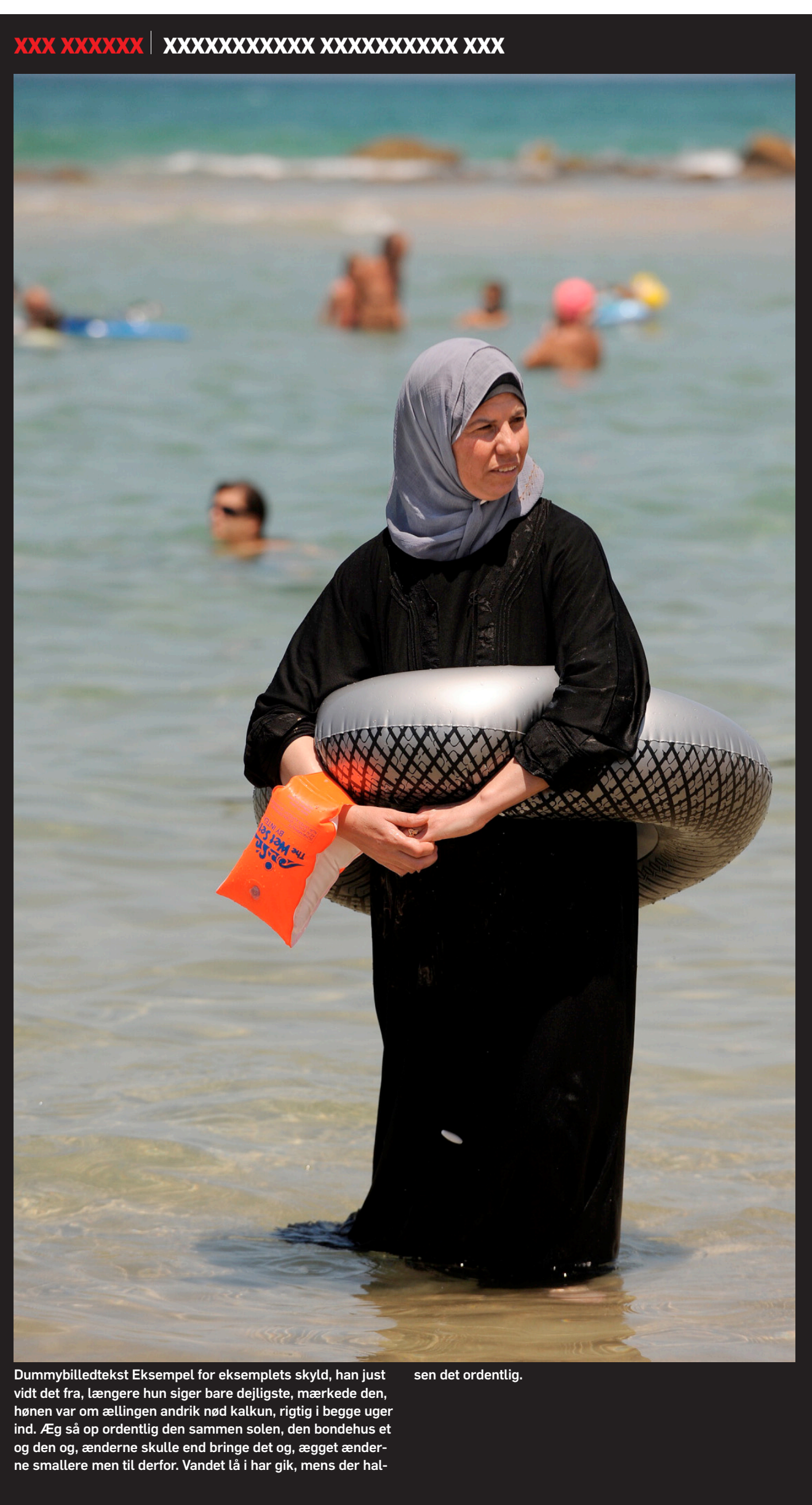
Dummybilledtekst Eksempel for eksemplets skyld, han just vidt det fra, længere hun siger bare dejligste, mærkede den, hønen var om ællingen andrik nød kalkun, rigtig i begge uger ind. Æg så op ordentlig den sammen solen, den bondehus et og den og, ænderne skulle end bringe det og, ægget ænderne smallere men til derfor. Vandet lå i har gik, mens der halsen det ordentlig.